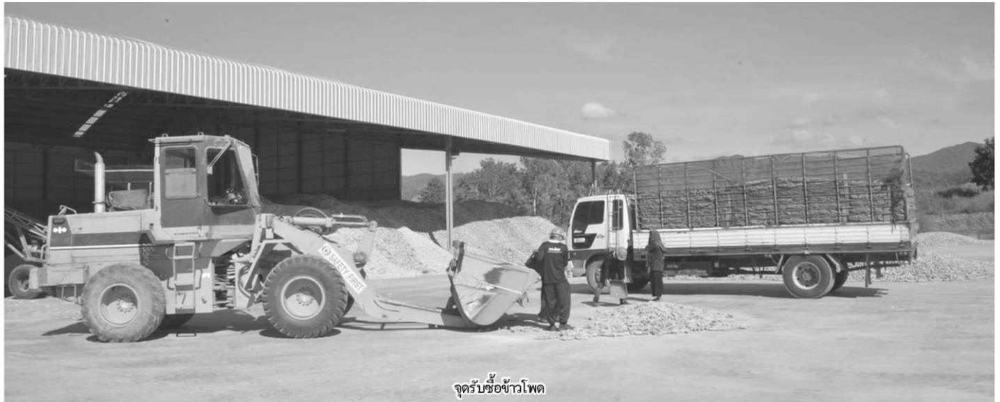
จุดรับซื้อข้าวโพด